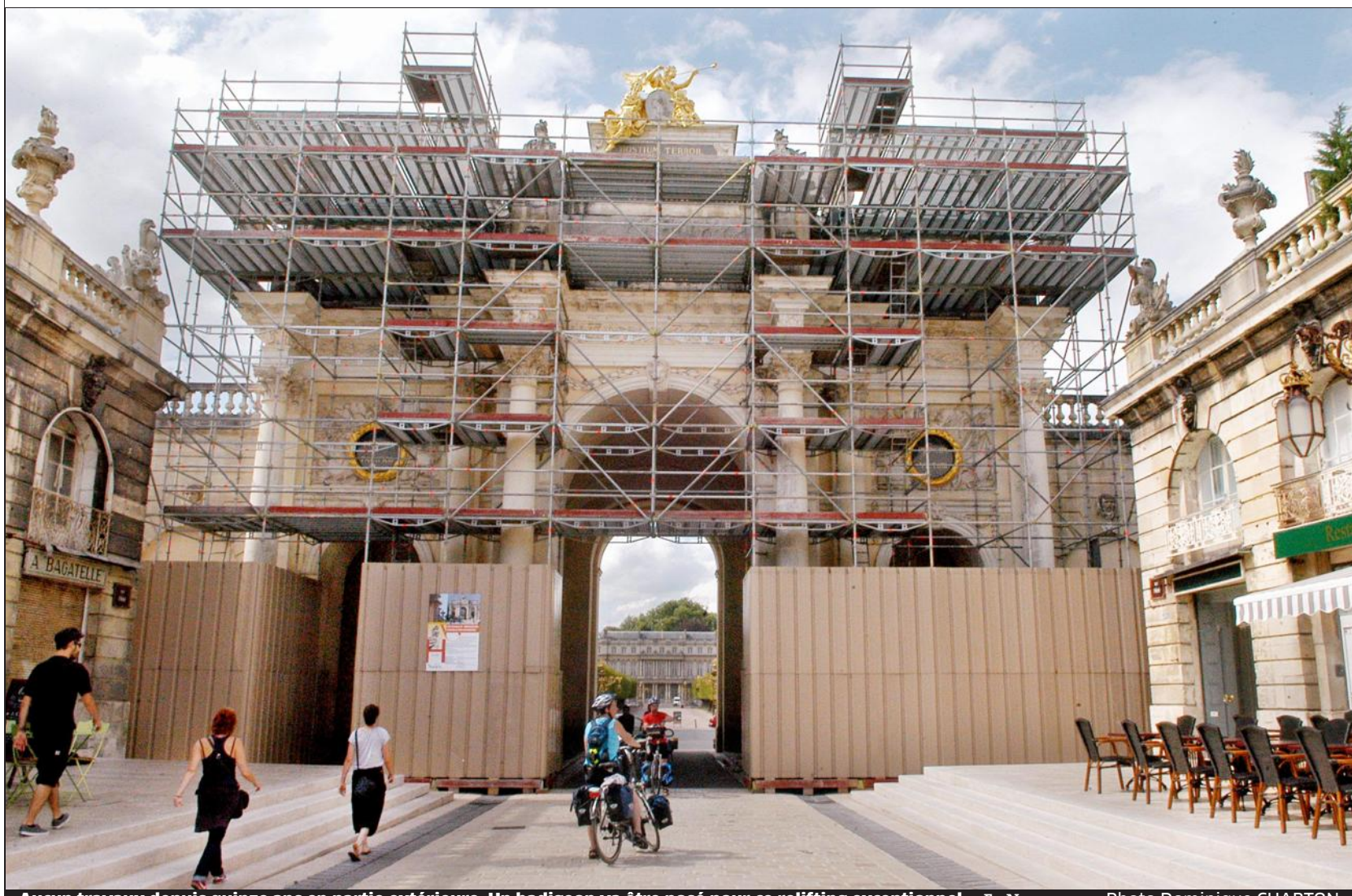
Aucun travaux depuis quinze ans en partie extérieure. Un badigeon va être posé pour ce relifting exceptionnel. En Nancy

Nancy Un cheval sous le capot pour les déchets