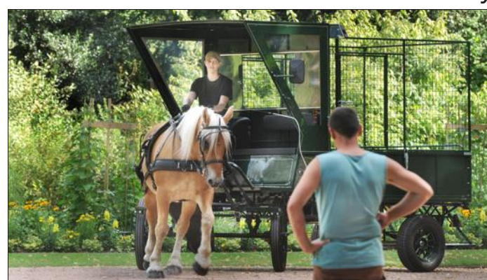
Le parc de la Pépinière s'est doté d'un véhicule hippottracté pour ramasser les déchets (140 poubelles) sur les 21 ha en cœur de ville.

Sion Potiers et céramistes au sommet de la colline