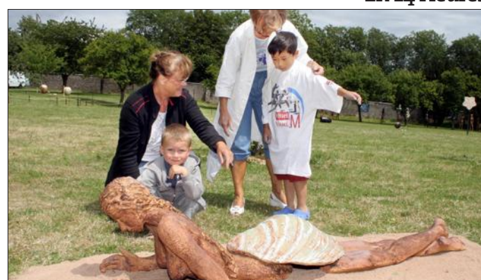
Marché des potiers et céramistes ce week-end sur la colline de Sion, où l'on va concentrer le savoir-faire et le faire savoir.

Pompey Représailles syndicales : le blocage de Raflatac