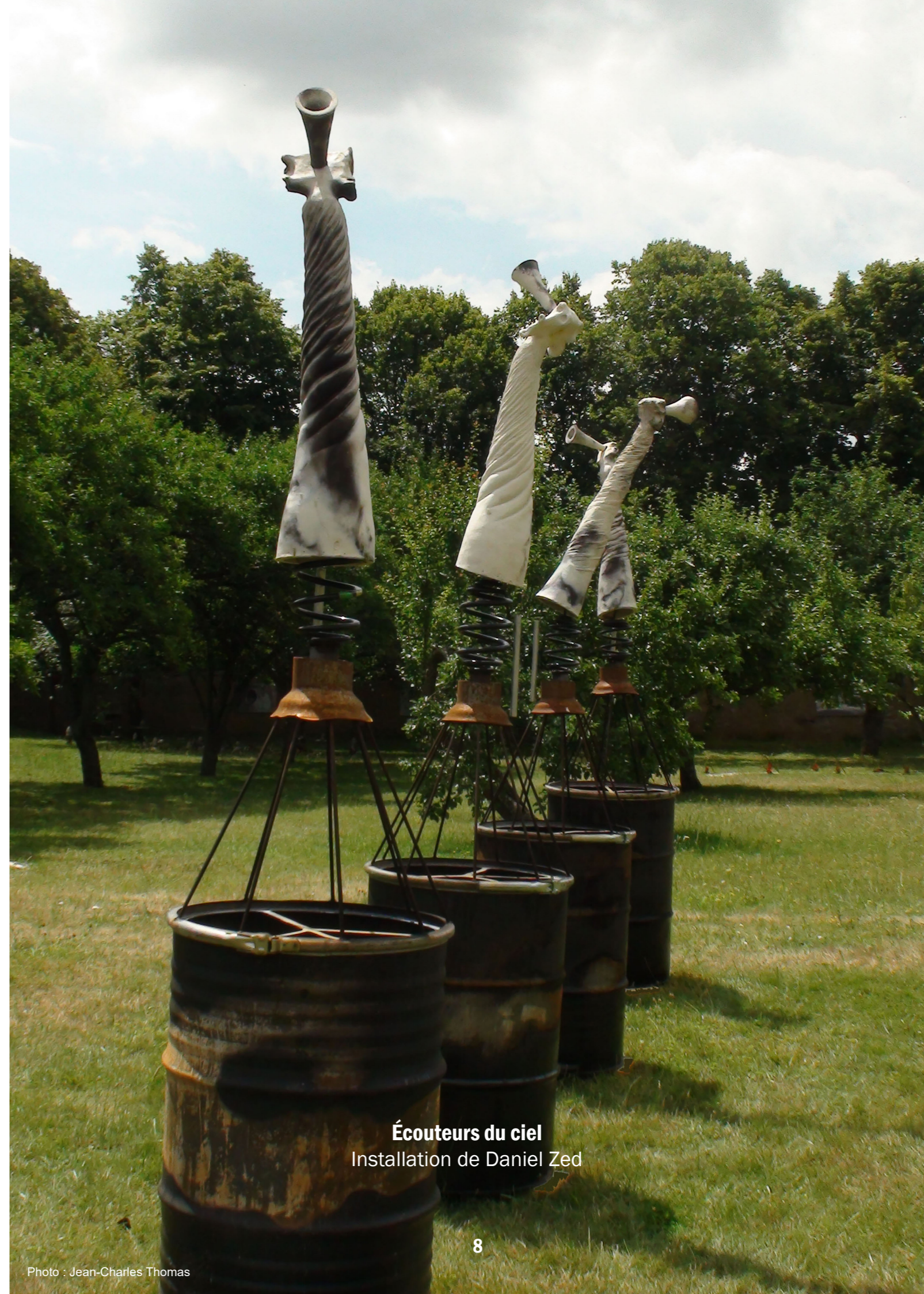
Écouteurs du ciel Installation de Daniel Zed