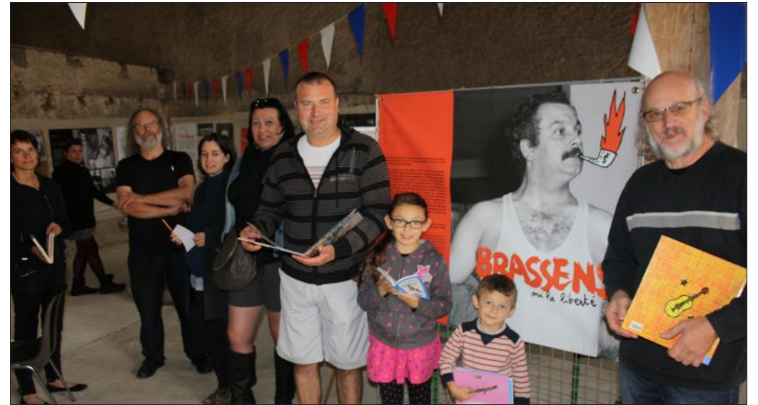
■ Une belle exposition sur Georges Brassens a ravi les visiteurs.

se Florimont, l'enfance, la jeunesse, les cabarets, le spectacle à Bobino. Les habitants pouvaient aussi consulter une quinzaine de livres mis à disposition sur ce poète au verbe libre et à l'humour mordant. Brassens a laissé des centaines de chansons admirablement servies par sa guitare et sa voix chaude. Une autre activité est prévue ce mercredi 23 septembre à 17 h, dans la Grange du relais de la Poste, où les responsables du Point lecture invitent nombreux la population à un spectacle de théâtre musical gratuit intitulé : « Cocoricocotte » par la compagnie Héliotrope. Réservation conseillée au 06.52.89.08.83.