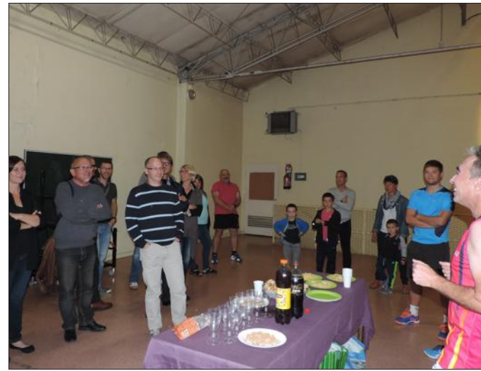
■ Une dernière occasion de pratiquer le badminton au gymnase Daniel-Depierre.