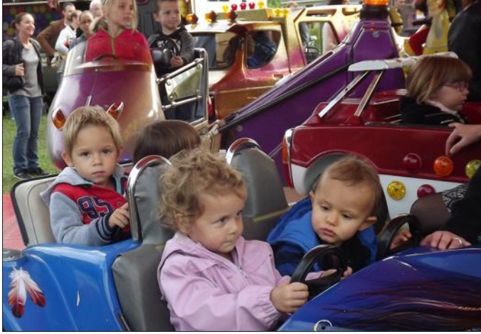
■ Le plaisir de tourner et de se retrouver entre copains.

Malgré un petit air frais, annonçant l'arrivée de l'automne, les Cadans sont venus nombreux au verre de l'amitié proposé par la municipalité pour inaugurer la fête patronale. Comme chaque troisième week-end de septembre, les attractions foraines étaient au rendez-vous. Les petits ont ainsi pu profiter du manège ou