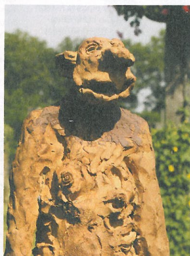
© Denis Margin - CG 54