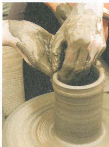
© Denis Margin - CG 54