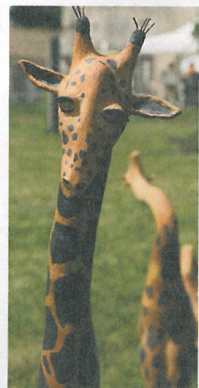
Œuvre de Shirley Manternay